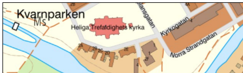
Figur 3. Exempelbild i skala 1:30 236 (SWEREF 99 TM).