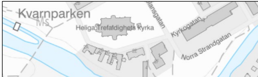
Figur 6. Exempelbild i skala 1:30 236 (SWEREF 99 TM).