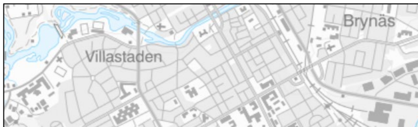
Figur 7. Exempelbild i skala 1:241 890 (SWEREF 99 TM).