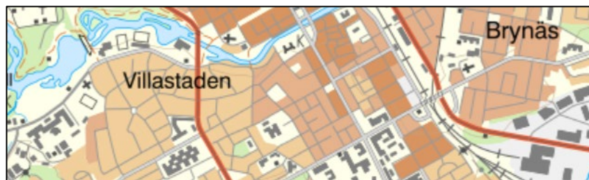
Figur 4. Exempelbild i skala 1:241 890 (SWEREF 99 TM).