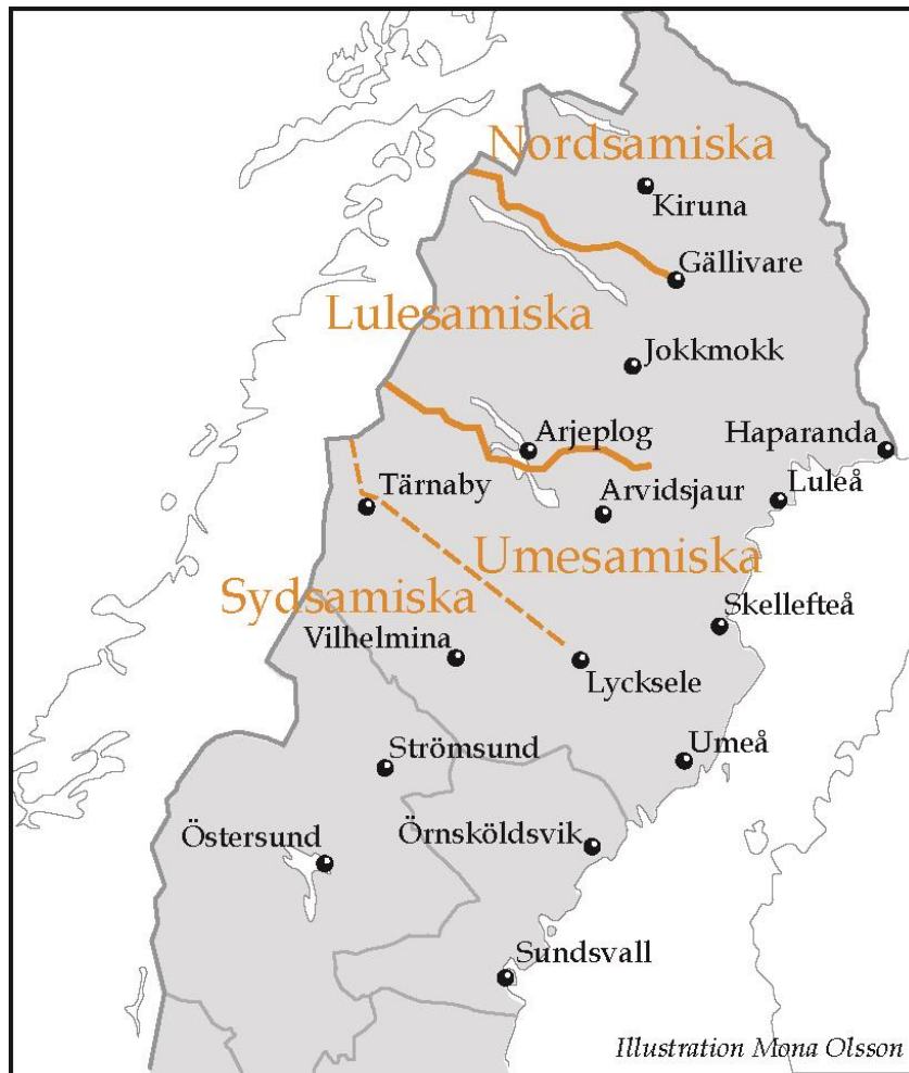
Figur 3. Karta över utbredningen av samiska språkområden.