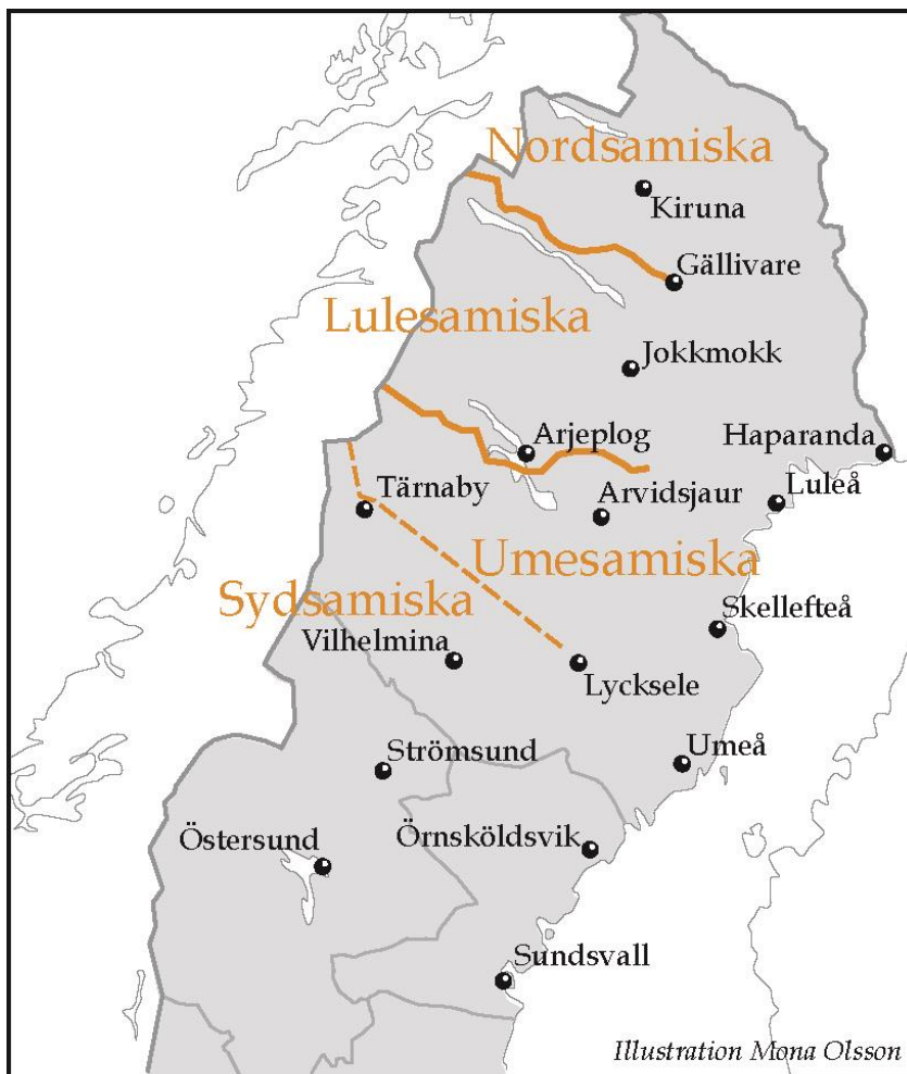
Figur 3. Karta över utbredningen av samiska språkområden.