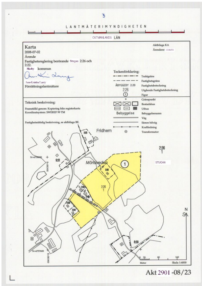
Figur 1. Exempel på en förrättningskarta i en akt.