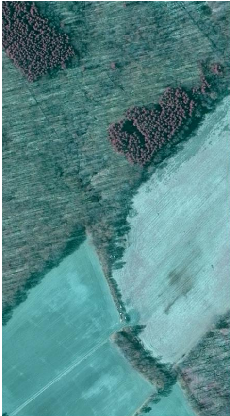
15 april 2010

Figur 3. Två exempelbilder. Bilden till vänster är tagen 15 april 2010, bilden till höger är tagen 4 juni 2010.