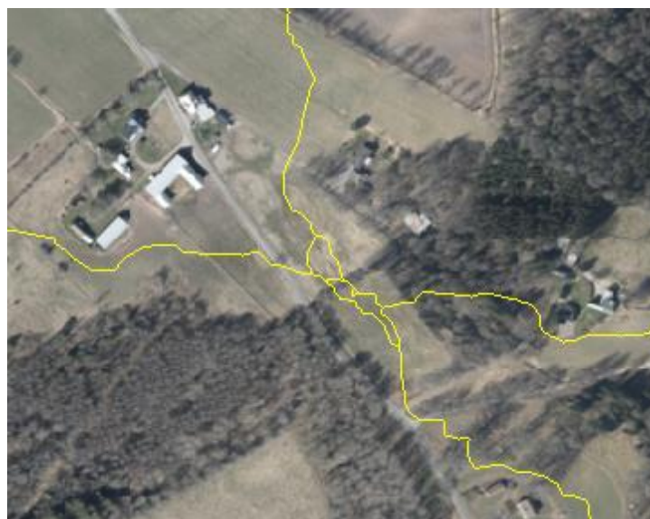
Figur 5. Exempel på öglor i flygbildssömmarna.

Vid genereringen av flygbildssömmar, som sker automatiskt, uppstår ibland öglor och öar i sömmarna. Exempel visas i figuren här nedanför. Dessa orsakar vanligtvis inga eller mycket små suddiga effekter i ortofotona.