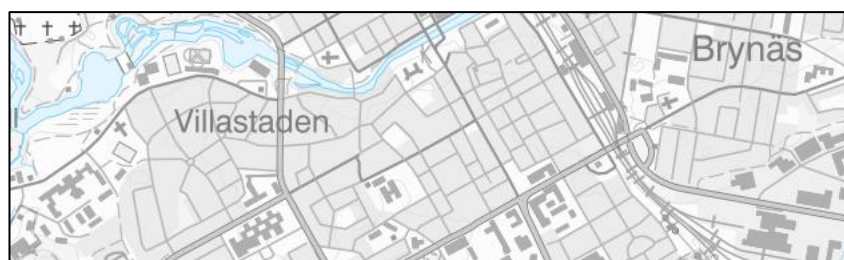
Figur 5. Exempelbild i skala 1:241 890 (SWEREF 99 TM).