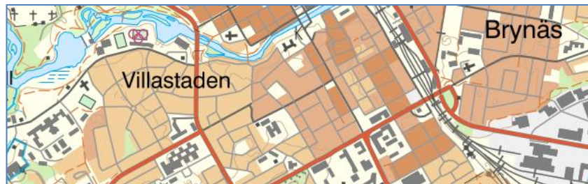
Figur 3. Exempelbild i skala 1:241 890 (SWEREF 99 TM).