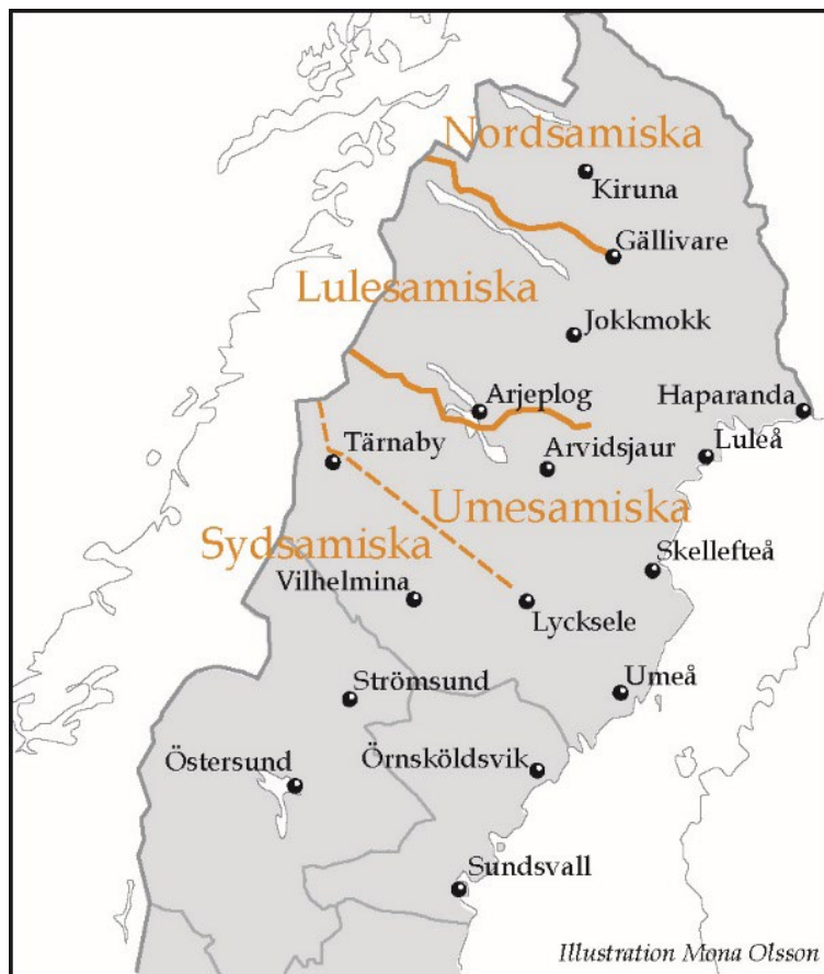
Figur 4. Karta över utbredningen av samiska språkområden.