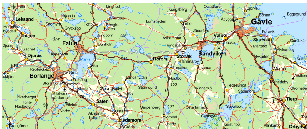
Figur 1. Utsnitt av GSD-Sverigekartan 1:1 miljon, vektor.