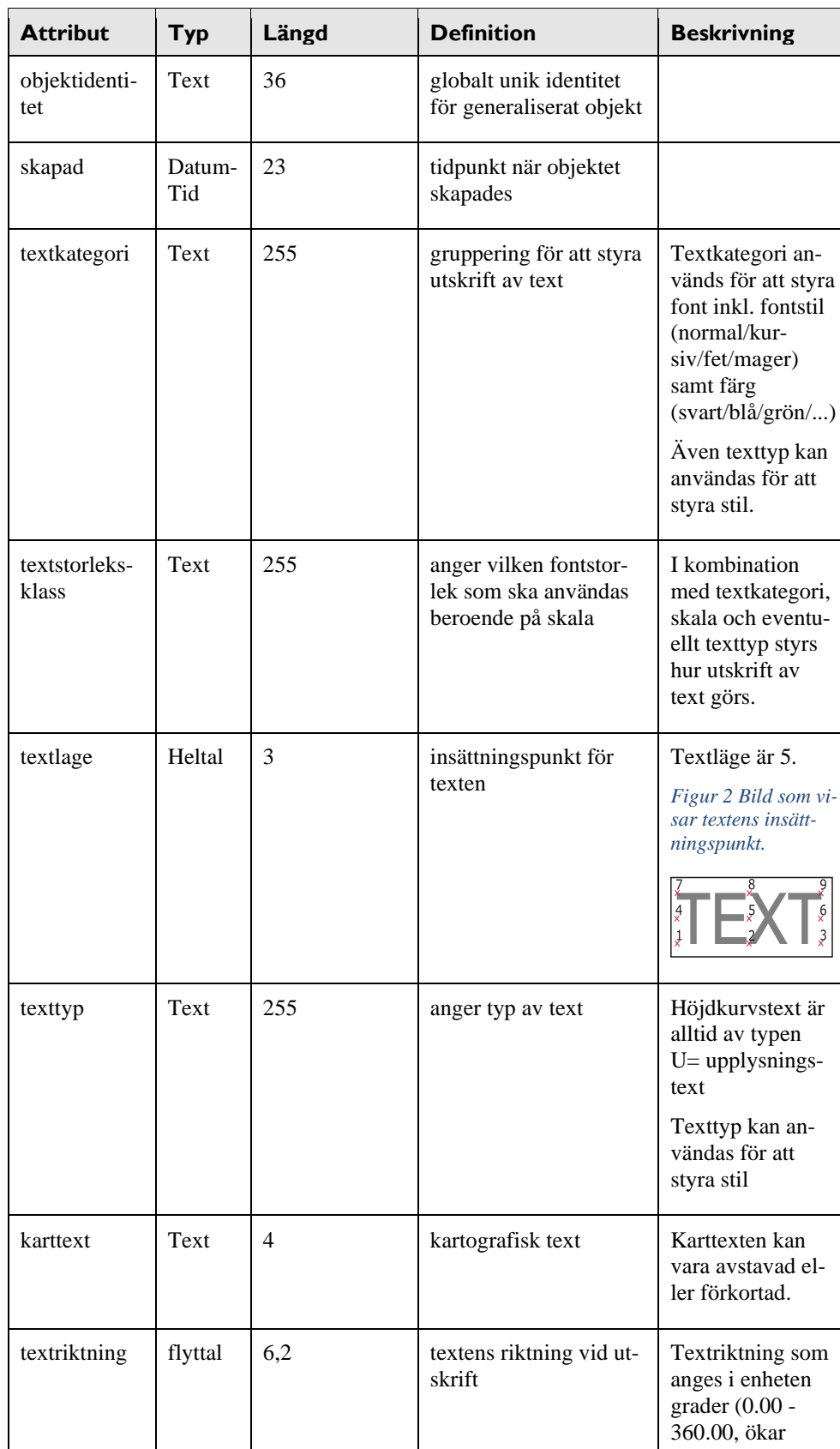
Tabell 50 Attributuppsättning för Höjdkurvstext