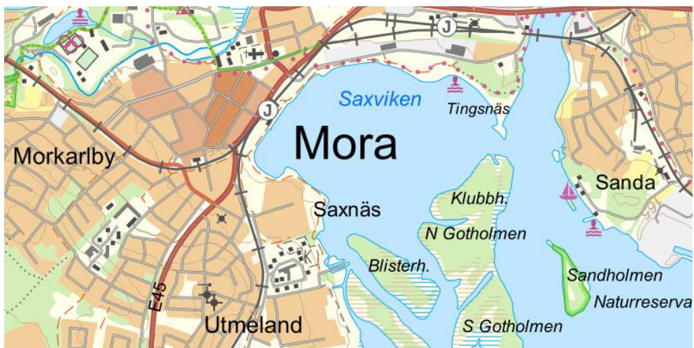
Figur 1 Utsnitt från Topografi 50 Nedladdning, vektor