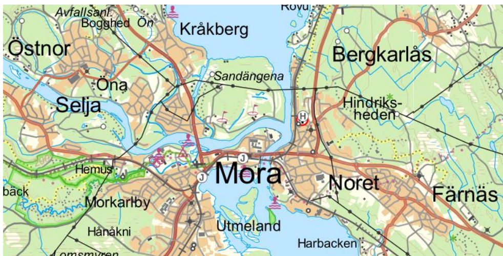
Figur 1 Utsnitt från Topografi 100 Nedladdning, vektor