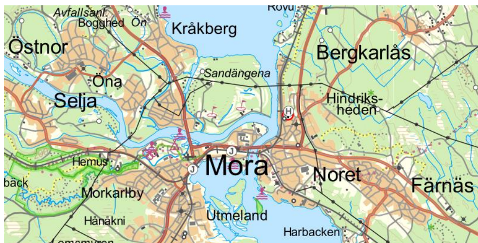
Figur 1 Utsnitt från Topografi 100 Nedladdning, vektor