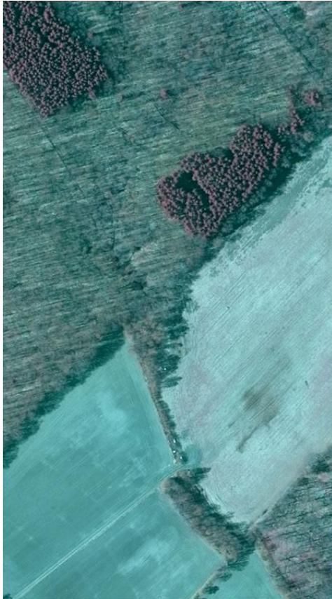
15 april 2010

Figur 3. Två exempelbilder. Bilden till vänster är tagen 15 april 2010, bilden till höger är tagen 4 juni 2010.