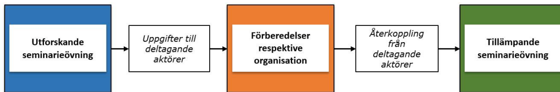
Figur 1. Övningens tre moment

KOORDINAT 16 genomförs i tre delar varav två genomförs gemensamt i form av seminarieövningar där man genom samtal och diskussion utvecklar förutbestämda förmågor.