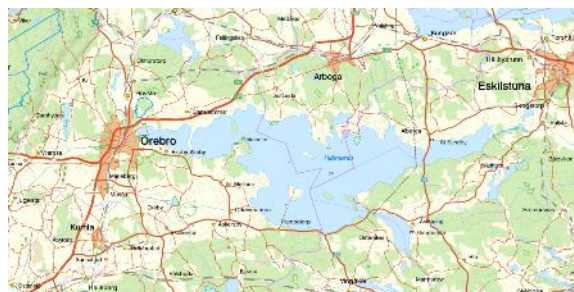
Figur 3. Området runt Örebro och Hjälmarren