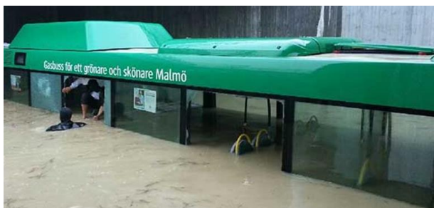
Figur 2. Höga vattenflöden i Malmö 2016

Scenariot är baserat på temat höga vattenflöden i området runt Örebro och Hjälmarren och är valt för att utgöra en situation med bred samhällspåverkan som påverkar flera olika typer av värden i samhället. Scenariot ska ses som ett verktyg för att ge lokala, regionala och centrala myndigheter/aktörer möjlighet att interagera med varandra och speglar därför inte en verklig händelseutveckling.